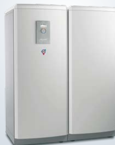
Diplomat Duo Optimum

Thermia Diplomat Duo Optimum är en variant av Thermia Diplomat Optimum. Det som skiljer de båda modellerna åt är att Thermia Diplomat Duo Optimum har separat varmvattenberedare, och därför passar på ställen med låg takhöjd.