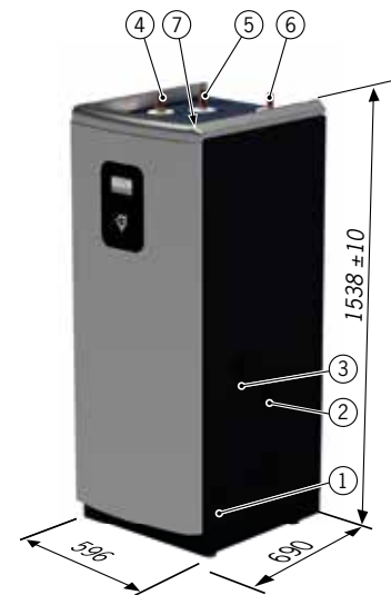
Diplomat Duo Inverter