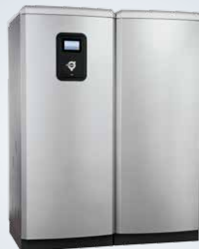
Diplomat Duo Inverter

Thermia Diplomat Duo Inverter är en modell med separat varmvattenberedare. Perfekt om du till exempel har lågt i tak eller extra stort varmvattenbehov. I övrigt är det samma värmepump.